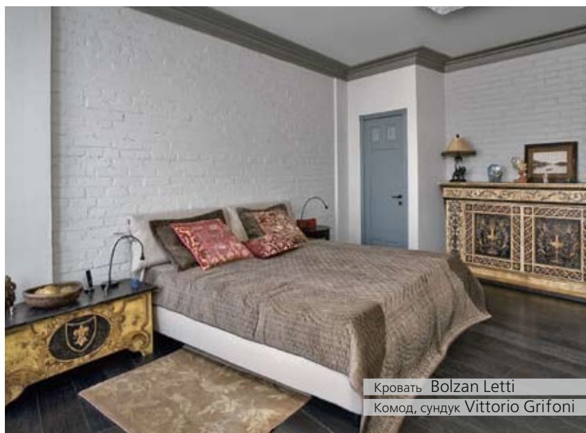
Кровать Bolzan Letti Комод, сундук Vittorio Grifoni