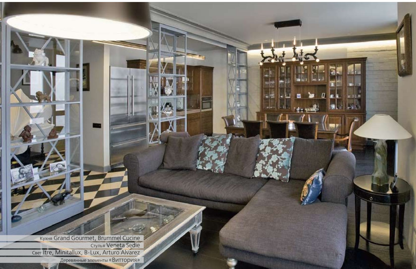
Кухня Grand Gourmet, Brummel Cucine Стулья Veneta Sedie Свет Itre, Minitallux, B-Lux, Arturo Alvarez Деревянные элементы «Виттория»