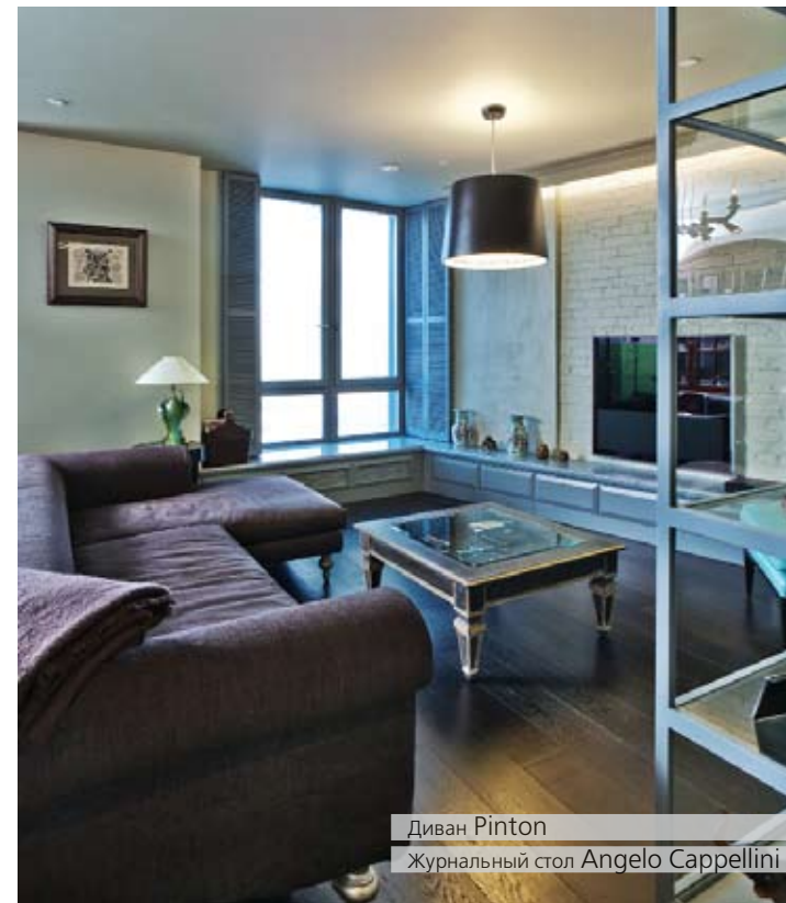
Диван Pinton Журнальный стол Angelo Cappellini

Дизайн — отражение двойственной человеческой природы, где уживается любовь к порядку и контрастам