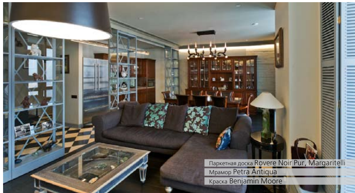
Паркетная доска Rovere Noir Pur, Margaritelli Мрамор Petra Antiqua Краска Benjamin Moore

Общая площадь 120 м 2 Архитектор Надежда Чак (студия «Интро») Съёмка февраль 2011 год