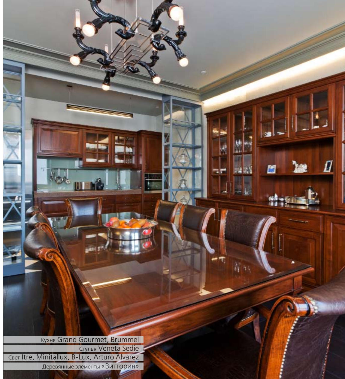
Кухня Grand Gourmet, Brummel Стулья Veneta Sedie Свет Itre, Minitallux, B-Lux, Arturo Alvarez Деревянные элементы «Виттория»

Чугунная лестница выполнена по авторским эскизам компанией «Литейный дом»