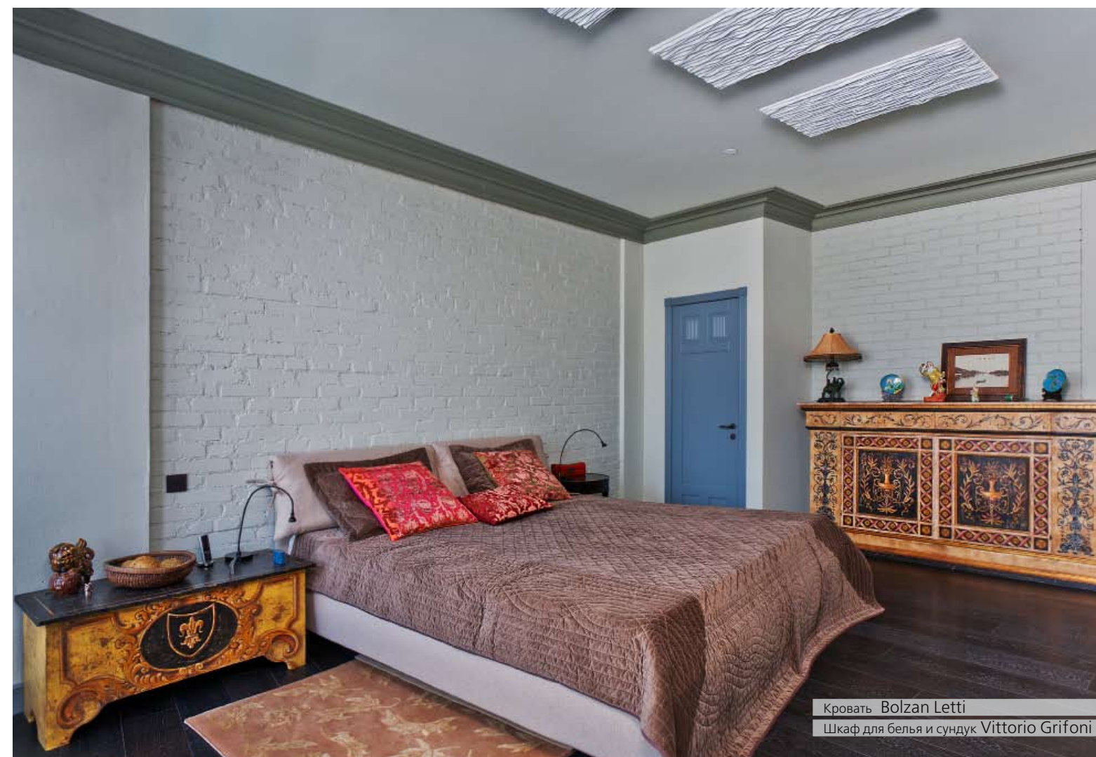
Кровать Bolzan Letti Шкаф для белья и сундук Vittorio Grifoni